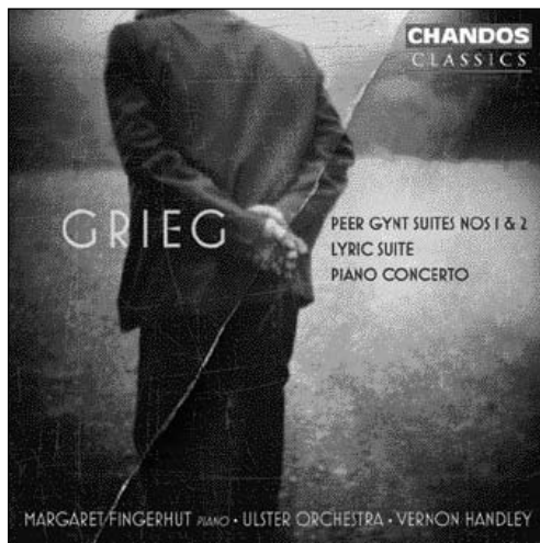
Grieg Peer Gynt Suites Nos 1 & 2 Lyric Suite Piano Concerto CHAN 10175 X

You can now purchase Chandos CDs directly from us. For further details please telephone +44 (0) 1206 225225 for Chandos Direct. Fax: +44 (0) 1206 225201. Chandos Records Ltd, Chandos House, Commerce Way, Colchester, Essex CO2 8HQ, UK E-mail: chandosdirect@chandos.net Website: www.chandos.net