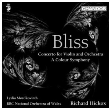
Bliss Concerto for Violin and Orchestra A Colour Symphony CHAN 10380