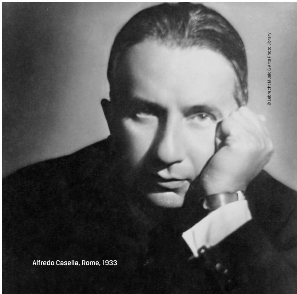
Alfredo Casella, Rome, 1933