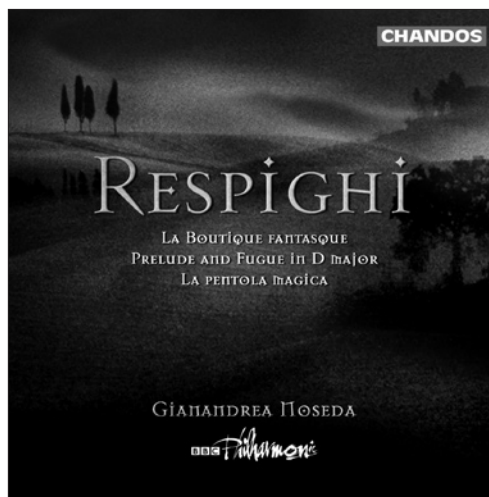
Respighi La Boutique fantasque • Prelude and Fugue in D major • La pentola magica CHAN 10081