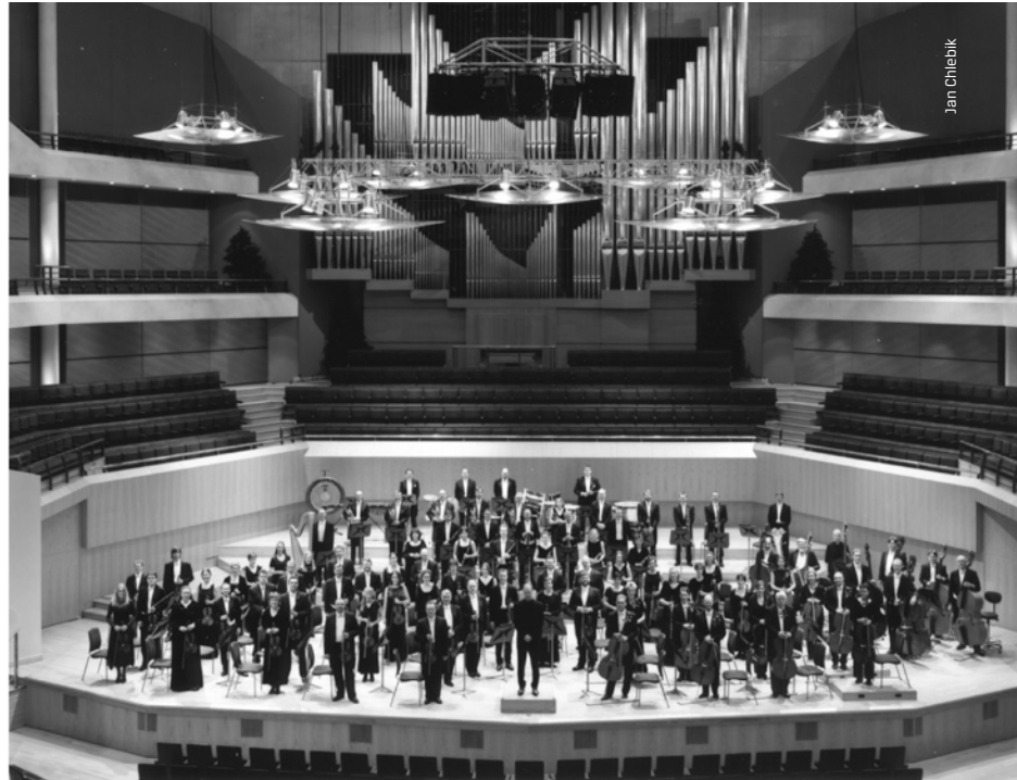
BBC Philharmonic, with Gianandrea Noseda