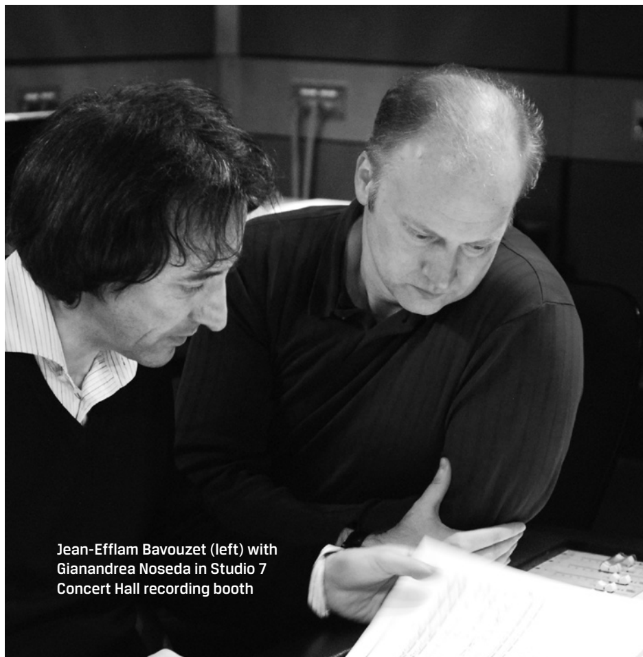
Jean-Efflam Bavouzet (left) with Gianandrea Noseda in Studio 7 Concert Hall recording booth