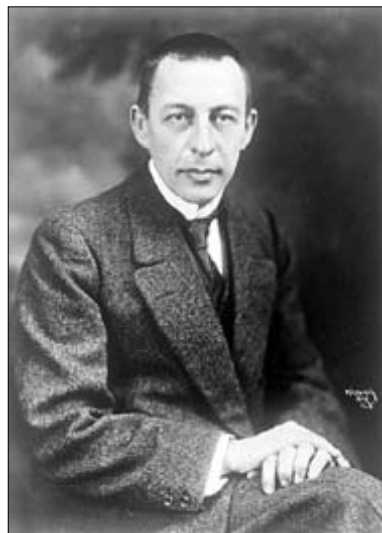
Mishkin / Lebrecht Music Collection