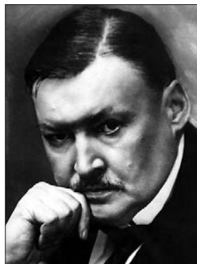
Anton Stepanovich Arensky