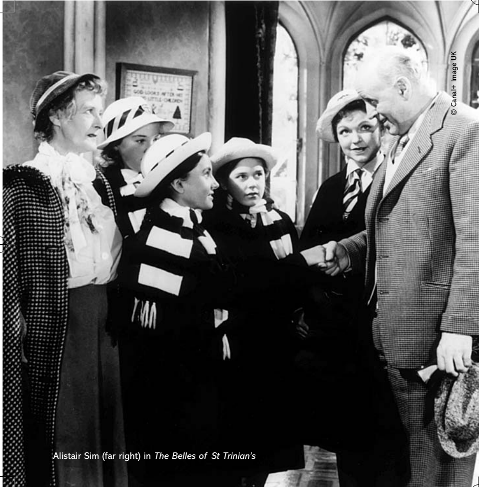
Alistair Sim (far right) in The Belles of St Trinian's