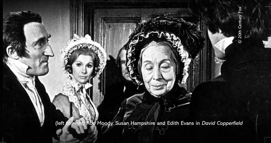
(left to right) Ron Moody, Susan Hampshire and Edith Evans in David Copperfield