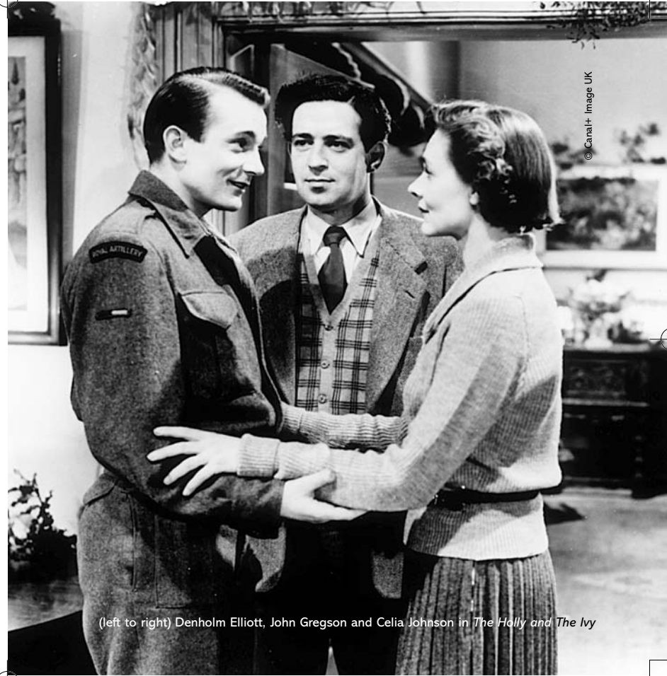
(left to right) Denholm Elliott, John Gregson and Celia Johnson in The Holly and The Ivy

A naval officer (Donald Sinden) is the protected 'guest' of the President of Agraria (a fictitious North-African state). The President (Akim Tamiroff) believes the officer has knowledge of a new secret naval weapon and has his buxom harem hold him prisoner until