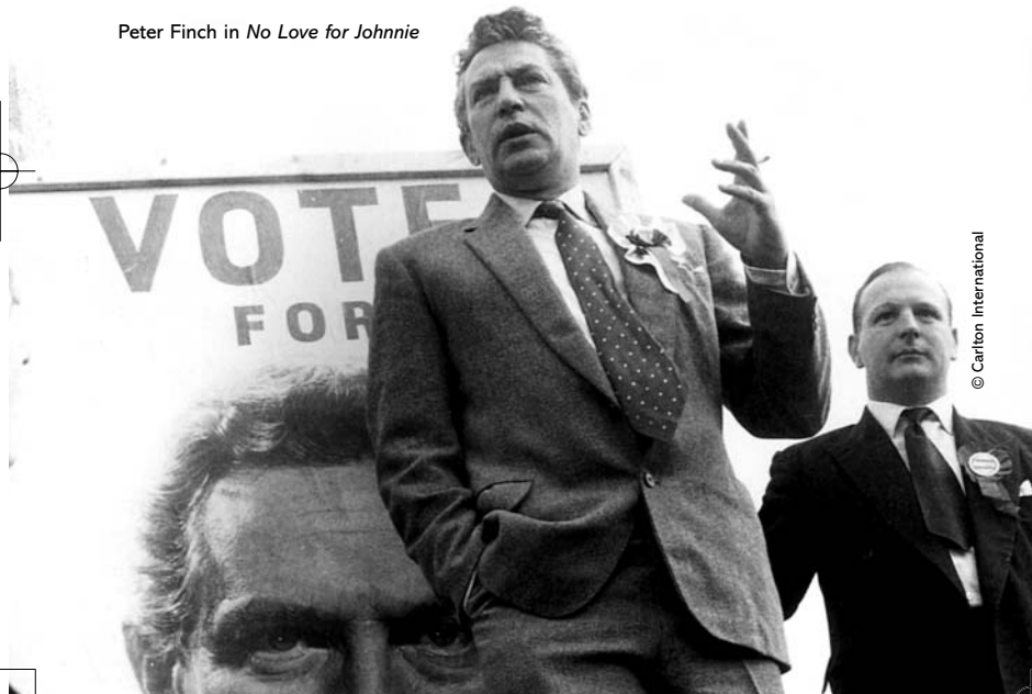
Peter Finch in No Love for Johnnie

diriger le BBC Scottish Symphony Orchestra, le Royal Liverpool Philharmonic Orchestra, le BBC Concert Orchestra, le Manchester Camerata, les London Mozart Players, le Royal Scottish National Orchestra et le Hallé Orchestra.