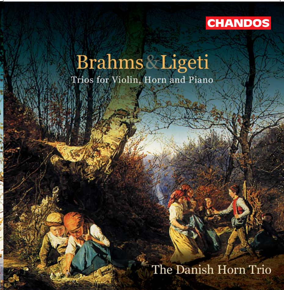
The Danish Horn Trio