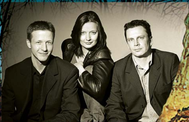
The Danish Horn Trio