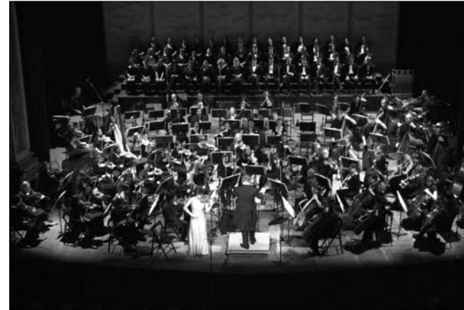
Spoleto Festival Choir and Spoleto Festival Orchestra Italy with Jennifer Koh and Richard Hickox, 2001