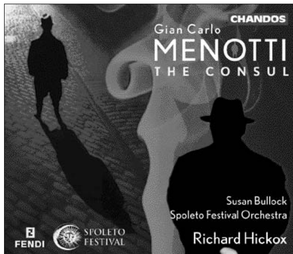
Menotti The Consul CHAN 9706(2)