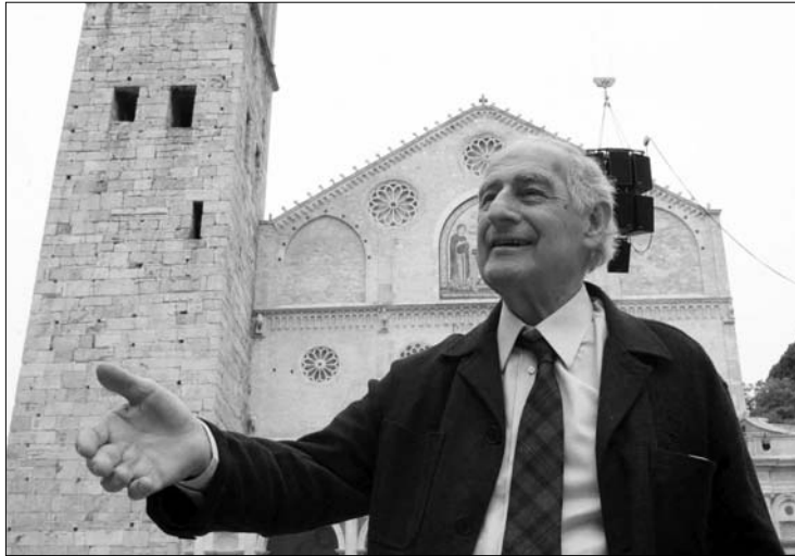
Gian Carlo Menotti