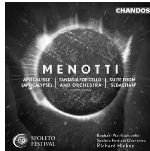
Menotti Apocalisse (Apocalypse) Fantasia for Cello and Orchestra Suite from 'Sebastian' CHAN 9900