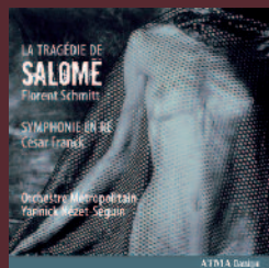
FLORENT SCHMITT LA TRAGÉDIE DE SALOMÉ ACD2 2647