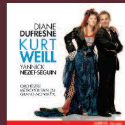
KURT WEILL avec / with Diane Dufresne ACD2 2324