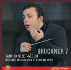
BRUCKNER 7 ACD2 2512