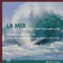
LA MER DEBUSSY • BRITTEN • MERCURE YANNICK NÉZET-SÉGUIN Orchestre Métropolitain du Grand Montréal SACD2 2549