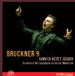
BRUCKNER 9 SACD2 2514