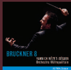
BRUCKNER 8 ACD2 2513